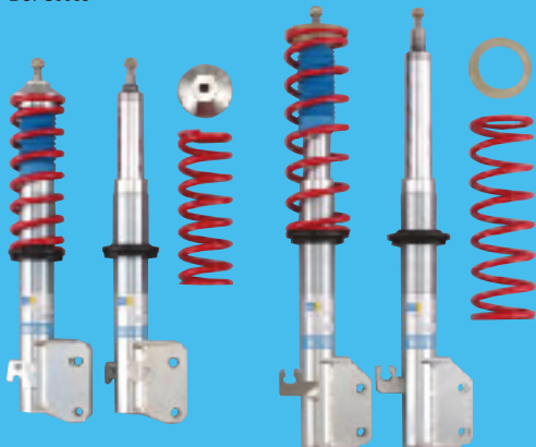
IMPREZA (GDB) C/D type Clubman Pack BCPS006J

クラブマンパックは走りを純粋に楽しむサーキット走行に向けてセットアップされたサスペンションキットです。ドライバーの意のままにクルマが曲がるナチュラルなハンドリング特性があって、はじめて限界走行の楽しさを満喫できる…こうした考えから、ダンパーの減衰力やスプリングレートが設定され、同時にスムーズなクルマの動きを生むサスペンションアームアングルを得るための車高がセットされています。クラブマンパックはしなやかに足が動き、高いスタビリティと路面からの豊かなインフォメーションを得る理想的なサスペンション特性を実現、サーキットやワインディングで爽快きまるドライブを提供します。